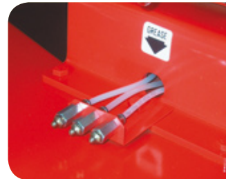
Option graissage centralisé