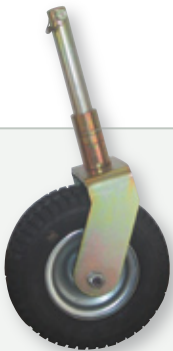
Option roues gonflables