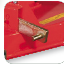
Bras de fixation