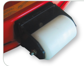
Option rouleau anti-scalp